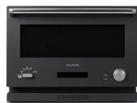
BALMUDA The Range