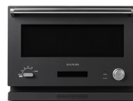
BALMUDA The Range