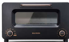
BALMUDA The Toaster Pro