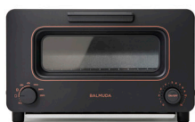
BALMUDA The Toaster

「キッチンを楽しく、テーブルをうれしく」というコンセプトのもと、 今後も作る喜びとおいしいうれしさをお届けしてまいります。