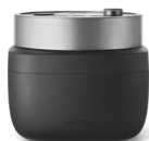
BALMUDA The Gohan