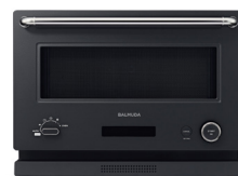
BALMUDA The Range